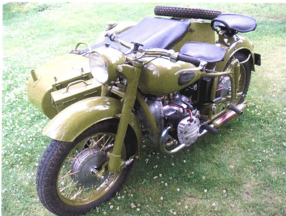
Diagonaalvaade esiosale ja vasakule küljele