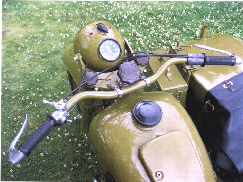
Vaade sõiduki juhtimisseadmetele