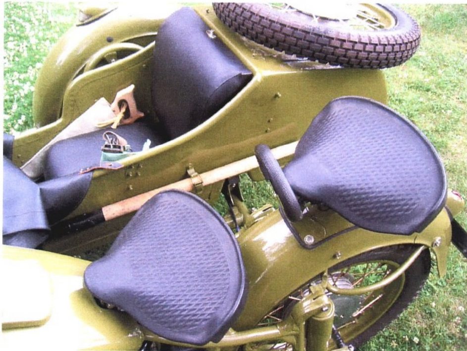
Vaade sõiduki istme(te)le