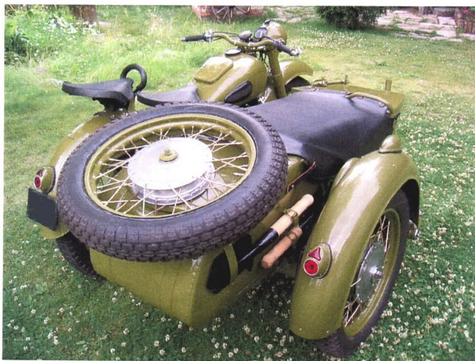
Diagonaalvaade tagaosale ja paremale küljele